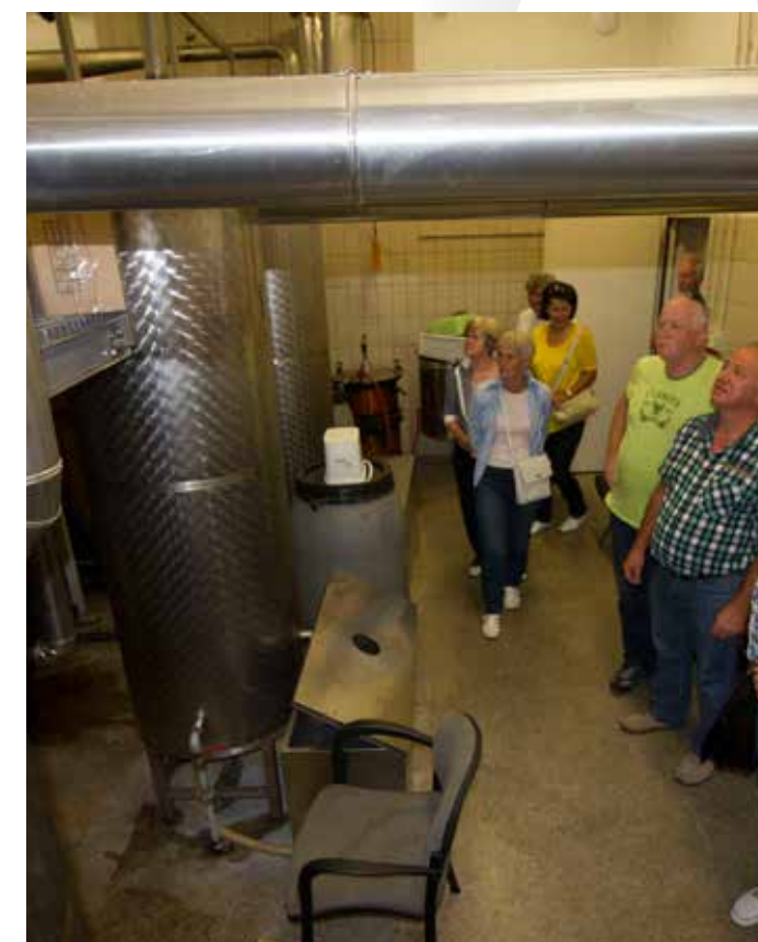
Obiskovalci v prostoru za destilacijo