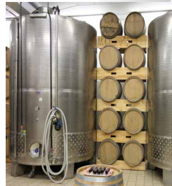
Prostor za fermentacijo

Spoznajte Svet ustvarjanj in se prepustite