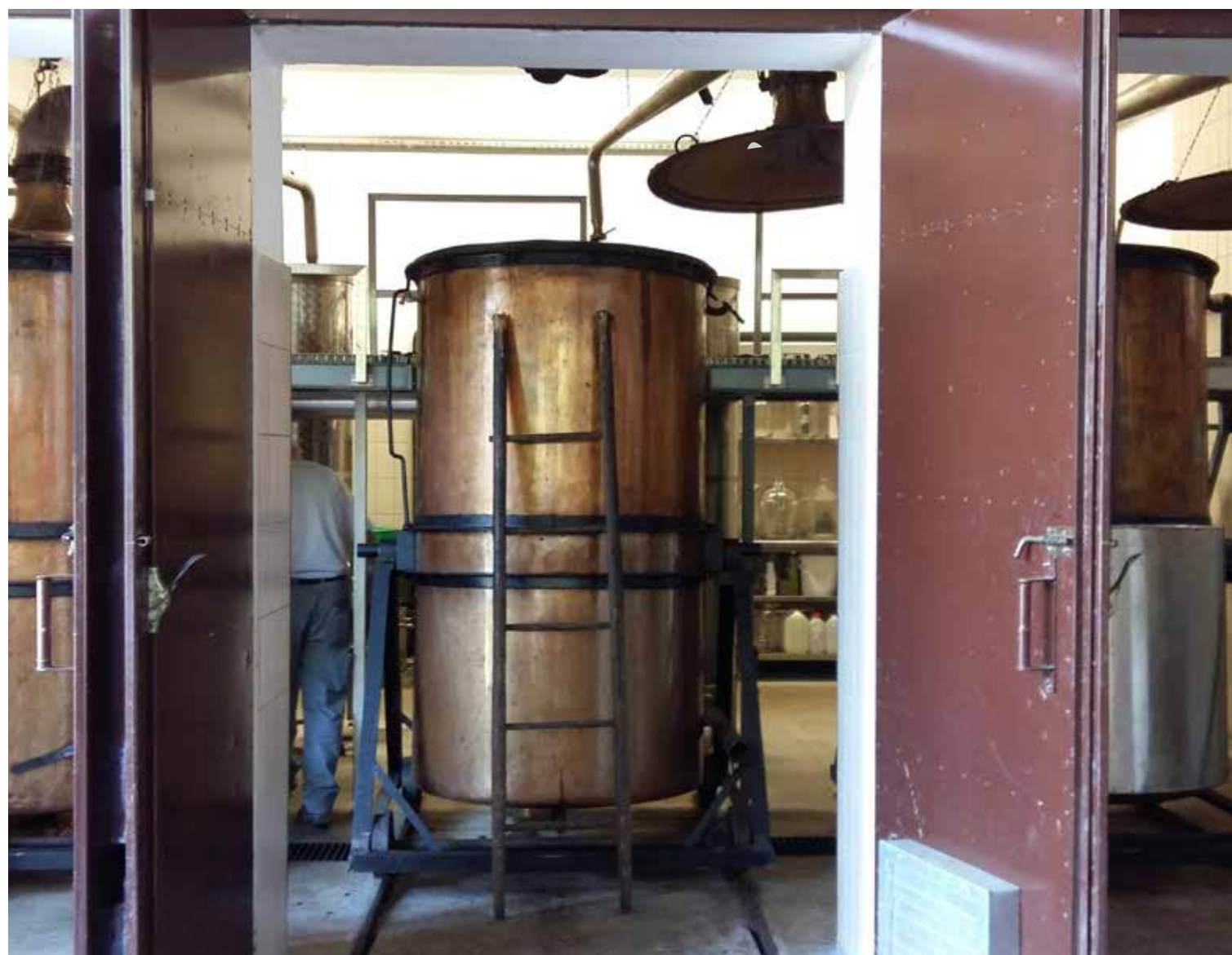
Srce naše destilarne - pristni destilacijski kotli

S sprehodom po prostorih, spoznate postopek mletja, destilacije in fermentacije surovin, do polnjenja, zapiranja in etiketiranja steklenic, kjer vse postopke izvajamo ročno.